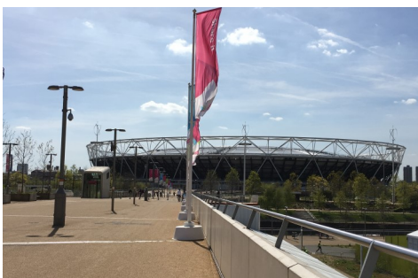
オリンピックのメインスタジアム