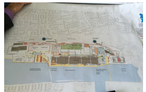
オリンピック開催時の会場動線図