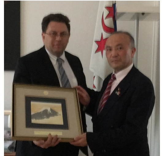
ベリ・モントルー市長と共に

今回のそれぞれの都市訪問の主な目的は、初めての訪問であったモントルー市は市内視察と国際オリンピック委員会視察で、4回目の訪問となったヒューストン市は米日カウンシル主催の「日本テキサス経済サミット」への出席、JCA(JFE Connections America)への視察でした。