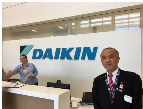
ダイキン・テキサス工場にて