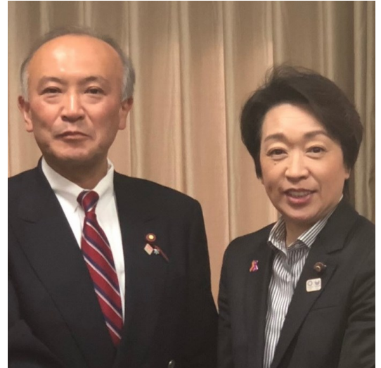
橋本聖子五輪相と共に