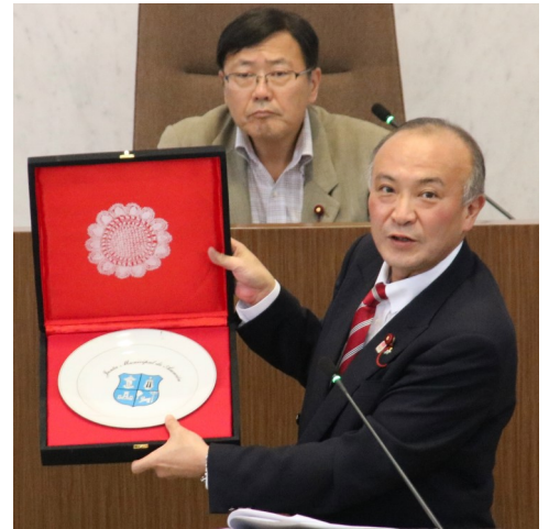
アスンシオン市からのお土産を披露 [アスンシオン市の市章の入ったお皿]