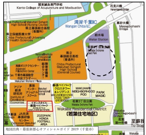
新病院建設予定地（美浜区若葉住宅地区）

この場所は更地で面積が広く、新たな場所に建設することから、新・現病院の何れも運営面（入院・診療等）支障をきたさないことが大きな決め手になったようです。